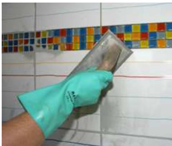
PCI ® Nanofug удобен в применении, твердеет независимо от температуры

Универсальная эластичная затирка для швов различной ширины и всех видов керамических покрытий